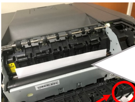
ローラーを回す白いギア

ローラー表面が汚れていると・・・ ⇒ローラー表面に極薄い膜状に、黒炭のようなものがついています。