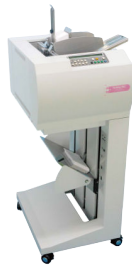
標準縦型モデル DA-6130 II