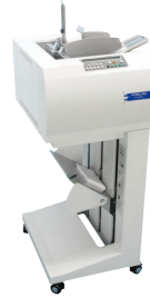
高速縦型モデル DA-6350 II