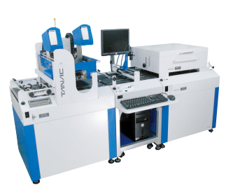
超高速型モデル SJ-20K オンライン 宛名検査装置