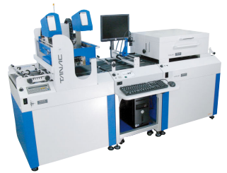
超高速型モデル SJ-20K オンライン +宛名検査装置